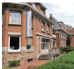
Centre Médical EUROPE - LAMBERMONT Rue des Pensées, 1- 5 1030 Bruxelles