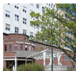
Site STE-ANNE ST-REMI Boulevard Jules Graindor, 66 1070 Bruxelles