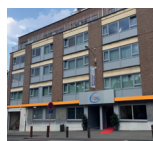
Clinique de la BASILIQUE Rue Pangaert, 37 - 47 1083 Bruxelles