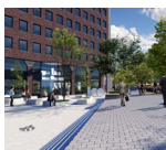
Centre Médical PARC LÉOPOLD Rue du Trône, 100 1050 Bruxelles