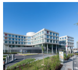
Site DELTA Boulevard du Triomphe, 201 1160 Bruxelles