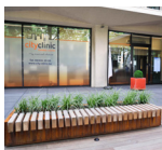
CITYCLINIC CHIREC Louise Avenue Louise, 235B 1050 Bruxelles